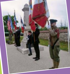
8 mai 1945