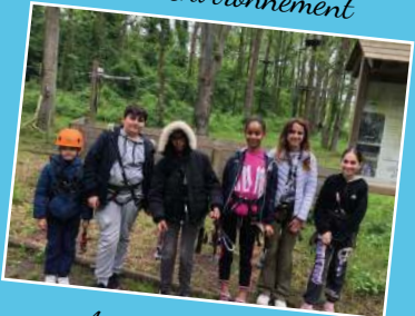
Accrobranche 1 er juin