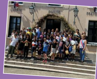
Ecole Paul Eluard - 25 juin