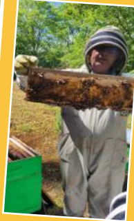
Atelier apiculture - Maternelles