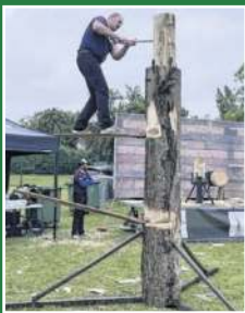
Bâcheronnage sportif 1 er juin