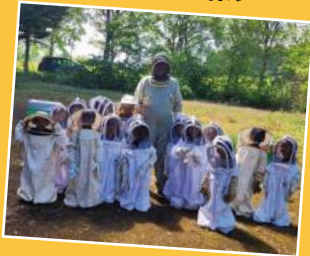
Mercredi 15 mai