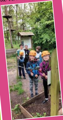
Accrobranche 1 er juin