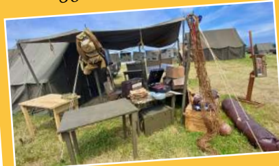
80 ème anniversaire du Débarquement & Libération du Mantois