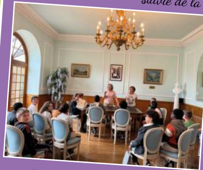
Ecole Victor Hugo - 21 juin