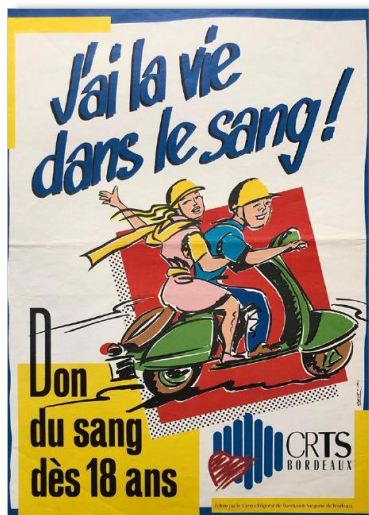
Anciennes affiches de promotion du don de sang des Centres de transfusion sanguine